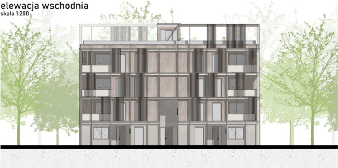
elewacja wschodnia skala 1:200