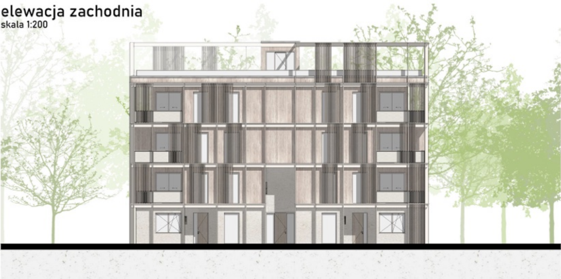
elewacja zachodnia skala 1:200